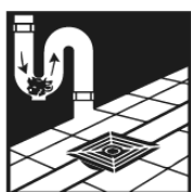
DRAINS - ΑΠΟΧΕΤΕΥΣΗ

Αποφρακτικό & καθαριστικό υγρό σωληνώσεων αποχετευτικού δικτύου